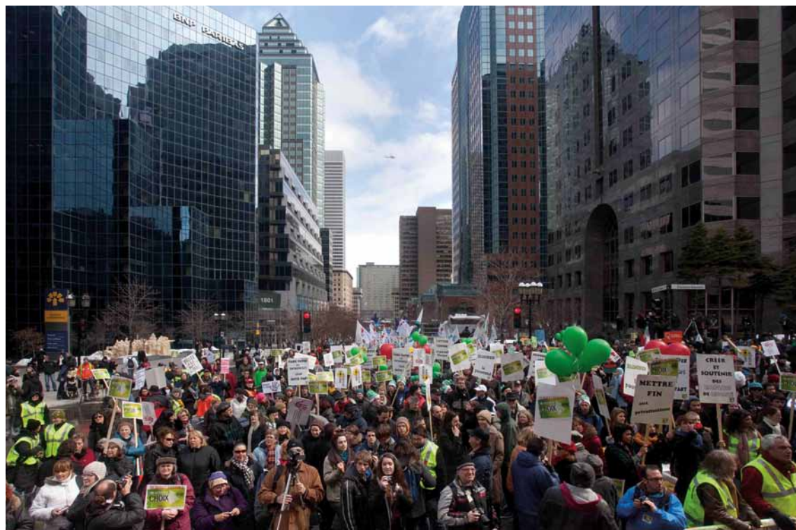
La FTQ et ses syndicats affiliés étaient nombreux à la manifestation pour un budget équitable pour tous et toutes « Monsieur Charest, d'autres voies sont possibles, il n'en tient qu'à vous, c'est une question de choix! », le 12 mars dernier. Plus de 50 000 personnes ont répondu à l'appel à manifester de l'Alliance sociale et de la Coalition opposée à la tarification et à la privatisation des services publics pour exiger du gouvernement Charest un changement de cap radical en matière budgétaire.

« Cela aurait dû convaincre le ministre de la nécessité de reporter le retour à l'équilibre budgétaire afin de stimuler davantage l'activité économique. D'autant plus que l'incertitude actuelle à l'échelle internationale peut menacer la reprise », a-t-il dit.