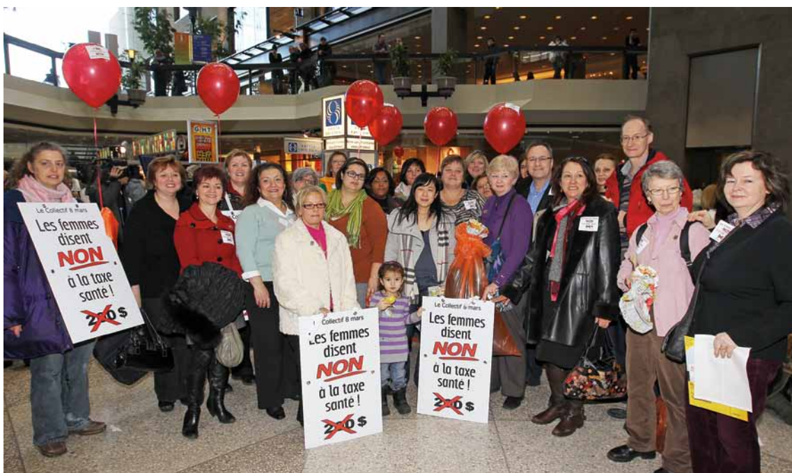
Une partie de la délégation FTQ à l'activité du 8 mars à Montréal.

RÉGIMES DE RETRAITE / SUITE DE LA PAGE 1