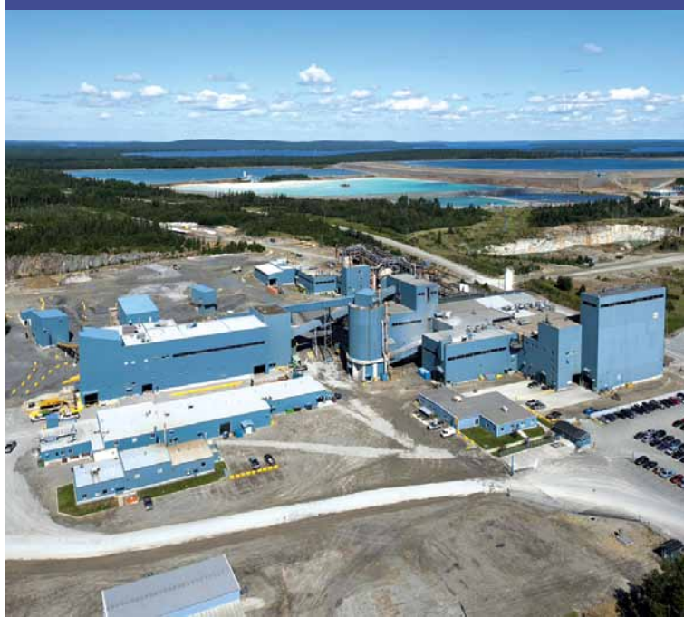
CONSEIL RÉGIONAL FTQ ABITIBI