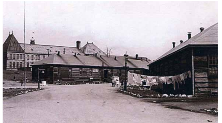
Le Village des pauvres de Québec. Bâties sur les plaines d'Abraham derrière le Manège militaire, une quarantaine de baraques servent d'abord comme camp pour quelque 800 prisonniers de guerre. Confrontée à une grave crise du logement au sortir des hostilités, la Ville de Québec y loue du gouvernement fédéral une vingtaine de baraques qui seront surnommées « le village des pauvres », ou encore le « faubourg de la misère ». Les derniers occupants furent évincés en mai 1951.