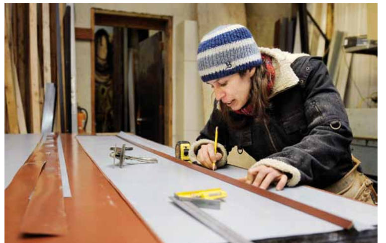
Un travail de ferblantier... Ici, on mesure avant de plier la tôle pour faire le tour des fenêtres.

Merci à Claude Maltais, conseiller régional FTQ pour la région de Québec et Chaudière-Appalaches, d'avoir rendu cette entrevue possible.