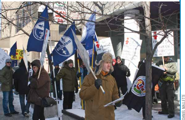
Le 15 février dernier, la FTQ s'est jointe aux manifestations mondiales pour les droits syndicaux en organisant une manifestation devant le consulat du Mexique à Montréal.

La FTQ s'est aussi mobilisée en réaction aux attaques contre les syndicats libres du Mexique. Des syndicalistes, des étudiants et des militants des droits de la personne ont participé dans plus d'une quarantaine de pays aux Journées mondiales d'action sur le Mexique lancées mondialement le 14 février. Pendant six jours, les syndicats du monde entier se sont rassemblés pour mener des actions, écrire des lettres et se réunir avec des personnalités politiques pour attirer l'attention sur les graves infractions aux droits du travail au Mexique. Les Journées mondiales d'action ont été organisées par la Confédération syndicale internationale (CSI) ainsi que par quatre fédérations syndicales internationales, la Fédération internationale des organisations de travailleurs de la métallurgie (FIOM), la Fédération internationale des ouvriers du transport (FIOT), la Fédération internationale des syndicats de travailleurs de la chimie, de l'énergie, des mines et des industries diverses (ICEM) et UNI Global Union.