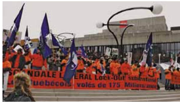
Le 22 avril, les lockoutés de Rio Tinto Alcan d'Alma participaient au Jour de la terre.

Cette marche a été suivie, le 16 avril dernier, par le lancement d'une campagne internationale demandant au Comité International Olympique (CIO) d'exclure le géant minier Rio Tinto de la liste des fournisseurs officiels des prochains Jeux olympiques de Londres. En effet, les métaux utilisés dans la fabrication des médailles olympiques proviennent de Rio Tinto. Cette demande a été appuyée par de