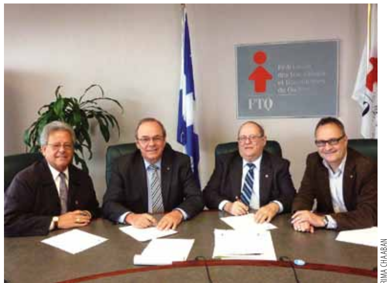
La Fédération des syndicalistes à la retraite du Québec (FSRQ) et la FTQ ont convenu d'un protocole qui assurera une plus grande visibilité aux regroupements de personnes retraitées issus de nos syndicats et de nos conseils régionaux. La FSRQ vise à défendre les droits des personnes à la retraite et à leur permettre de participer aux activités et aux mobilisations de la FTQ.

La bataille n'est pas gagnée. Par solidarité et équité entre les générations, il faudra mobiliser nos membres et les informer davantage sur les enjeux des régimes de retraite. Et il faudra s'assurer de répartir l'effort et le risque équitablement entre les employeurs et les travailleurs.