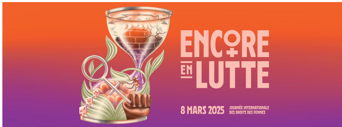
COLLECTIF 8 MARS. ILLUSTRATION: CHLOÉ BIOCCA. AGENCE: MOLOTOV